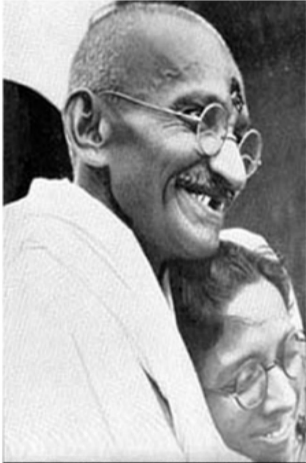
Gandhi with Maniben, daughter of Sardar Patel, on his day of departure for Round Table Conference, London, August 29, 1931

अपनी विभिन्न यात्राओं के दौरान गांधी जी ने देखा कि 'देश में हजारों लाखों लोग ऐसे हैं जो सिर्फ बड़ी मुश्किल से लंगोटी की व्यवस्था कर पाते हैं।' गहन विचार के बाद गांधी जी ने गरीबों का दुःख बांटने के लिए वस्त्रों का परित्याग कर 'आधी धोती' को धारण कर लिया। उन्होंने निर्णय लिया कि, 'जब तक देश में एक भी नागरिक ऐसा है जिसके पास पूरा तन ढकने को वस्त्र न हो तब तक मैं इस आधी धोती में रहूंगा।'